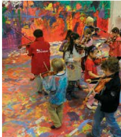
Ein Projekt der Louise Schroeder Schule