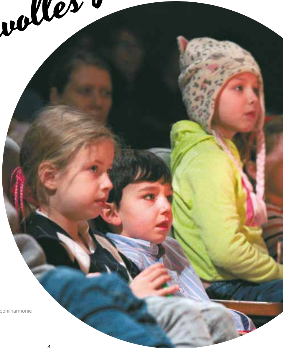
Kinder beim Besuch einer Veranstaltung in der Elbphilharmonie